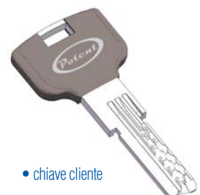
• chiave cliente