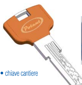
• chiave cantiere

La rotazione di 360° di una qualsiasi delle chiavi Grigia in dotazione su entrambi i lati del cilindro annullano il funzionamento della chiave Arancione da cantiere. Tale chiave non potrà più essere utilizzata in futuro per l'apertura o la chiusura del cilindro.